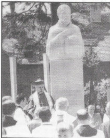
Poświęcenie pomnika ks. Jakuba Wujka w Wągrowcu w dniu 27.05.1973 r. przez Księdza Prymasa Stefana Kardynała Wyszyńskiego